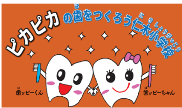
(児童の公募によるキャラクター)