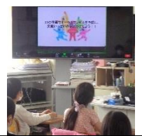
放送:フレイル予防