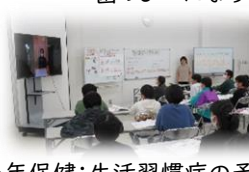
6年保健:生活習慣病の予防