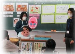
4年学活:しっかりかんで 歯っぴーになろう