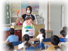
2年学活:きゅうしょくのひみつ