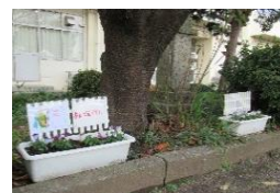
花いっぱい:安全花だん