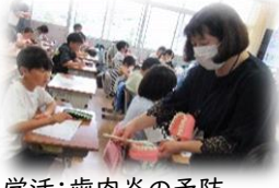
5年学活:歯肉炎の予防