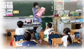
1年学活:歯のおうさまをみがこう