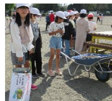
環境:けが予防石拾い