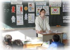
3年学活:大切な命の守り方