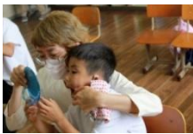
「親子でみがき残しをチェック」

タブレットで自分の歯を撮影したり、染め出しや、咀嚼ガムなどを使用し、授業を行いました。親子でみがけていないところを確認することができ、家庭での歯みがきに生かすことができました。