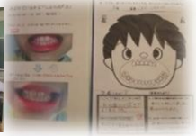
「個別ファイルで成長を可視化」