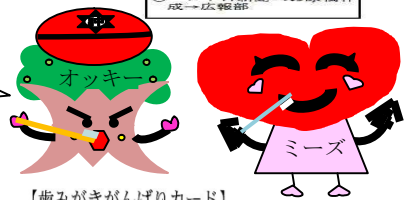
【歯みがきがんばりカード】