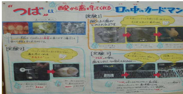
(つばのはたらきやかむことの大切さ)