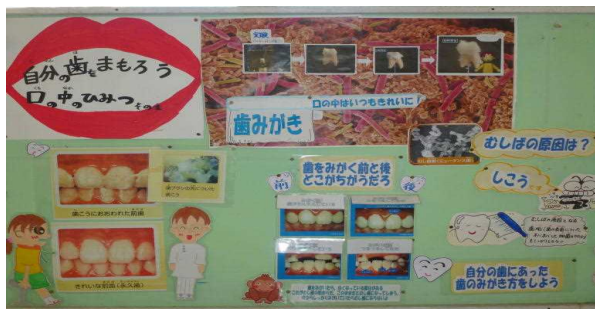
(むし歯の原因と歯のみがき方)