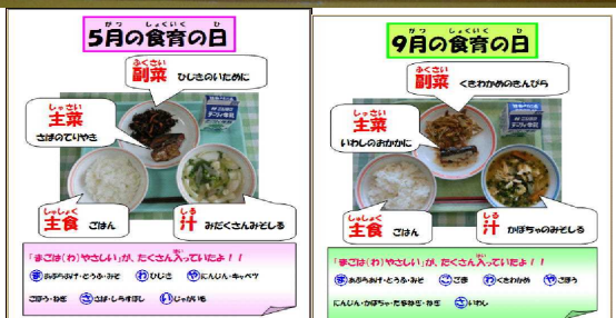
各学級では、給食時間に給食カレンダーで紹介する。