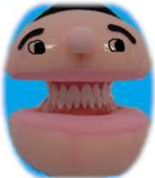
はが ひかる くん （歯の模型）

これからも、引き続き個別の口腔清掃法や学校歯 科医・歯科衛生士によるブラッシング指導、冬休みの 歯みがきカレンダーに取り組めます!