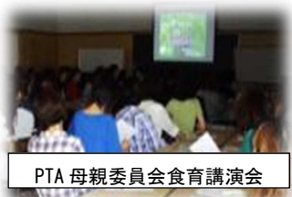
PTA 母親委員会食育講演会