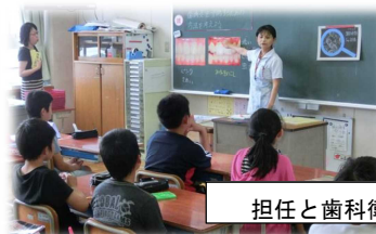
担任と歯科衛生士によるT.T指導