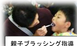
親子ブラッシング指導